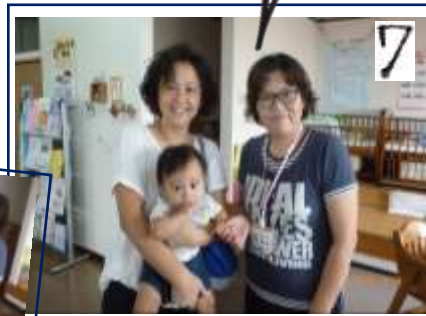
【ママからサイン貰って…ハイ！活動終了】