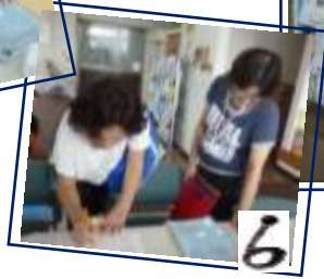
【報告書の記入方法を教わり…】